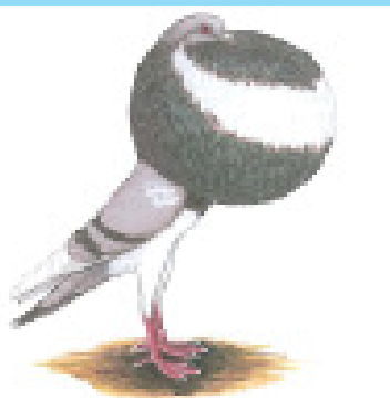
The Fancy Pigeon

E-pos: hennie@bioworx.co.za Webwerf: www.bioworx-pigeon.co.za